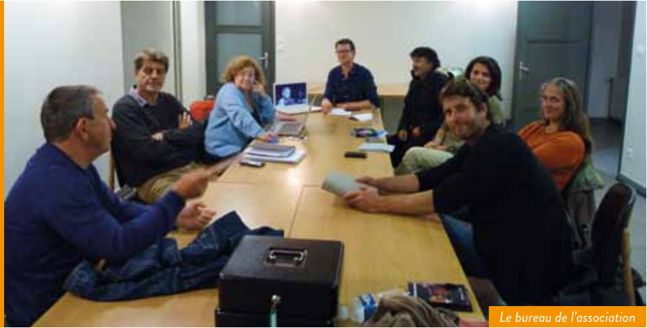
Le bureau de l'association